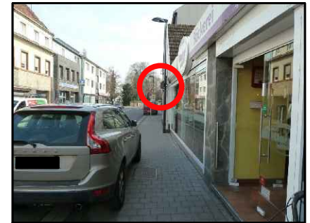
vor Hausnr. 39